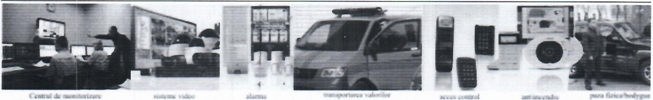
Centrul de monitorizare