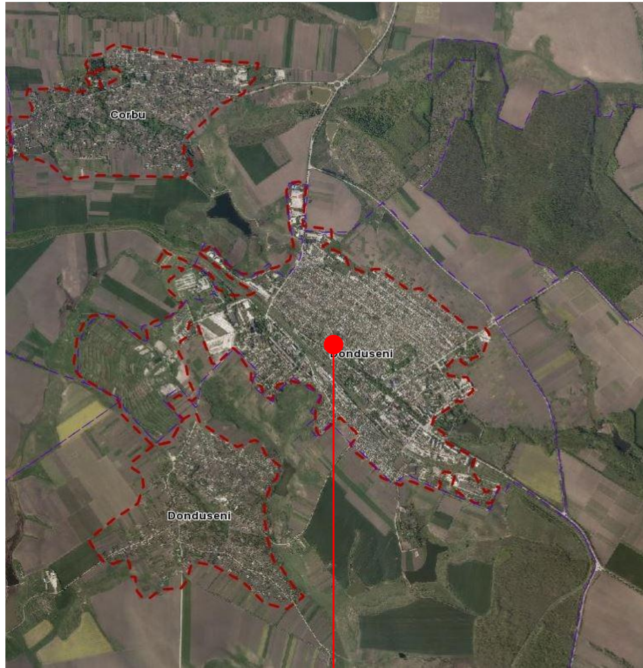
Zona de interventie