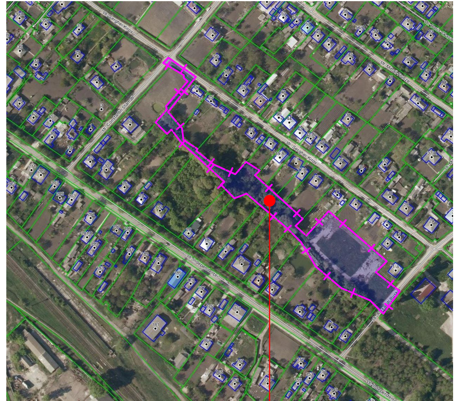
Teren proprietate publica