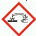
GHS 05 - Coroziv

Fraze de pericol: H 290: Poate fi coroziv pentru metale. H 314: Provoaca arsuri grave ale pielii si lezarea ochilor. H 335: Poate provoca iritarea cailor respiratorii.