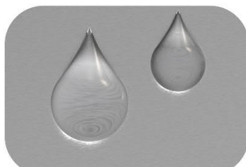
CADRU REZISTENT LA APĂ ALUMINIU - OȚEL INOXIDABIL