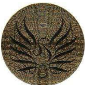
Registrar and Secretary