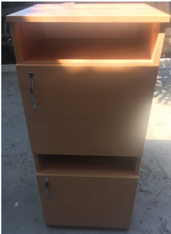
Tumbă pentru 2 persoane