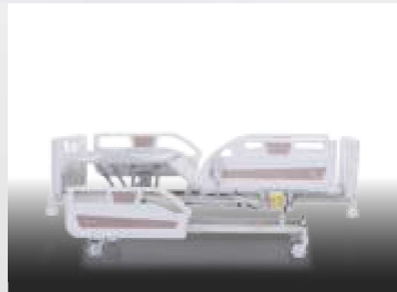
Ayak Hareketi / Legrest