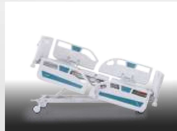
Trendelenburg / Trendelenburg