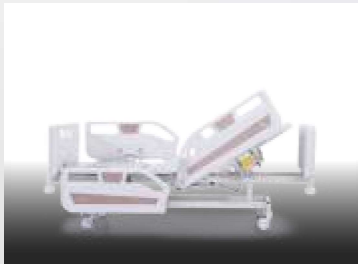
Sirt Hareketi / Backrest