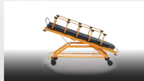
Düz Trendelenburg / Trendelenburg