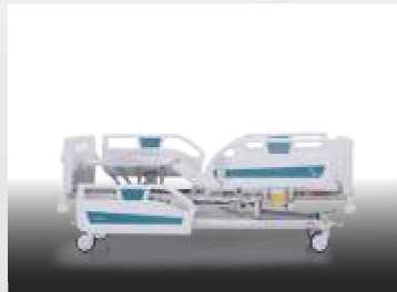
Ayak Hareketi / Legrest