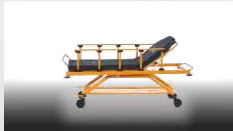
Sırt Hareketi / Backrest