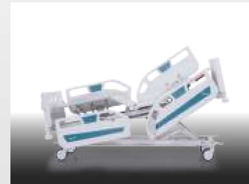
Kardiyak / Cardiac Chair