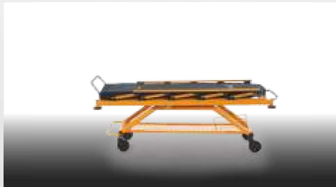
Transfer Pozisyonu / Transfer Position