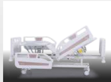
Sirt - Ayak Hareketi / Auto Contour