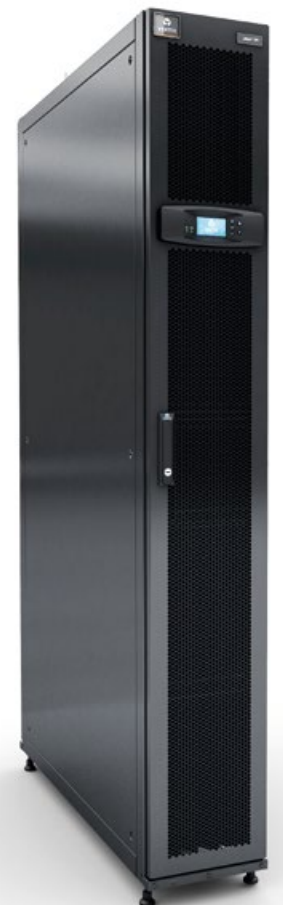
Система Liebert CRV 300 мм DX

За счет применения простой системы расположения кабелей и трубок, выведенных в верхнюю и нижнюю часть блока, монтаж устройства не составляет труда.