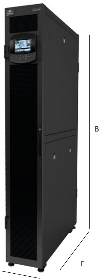
Ш Система Liebert® CRV 300 мм CW

Примечание. Приведенные выше показатели производительности соответствуют температуре воздуха на входе 38 °С, температуре конденсации для блоков с воздушным и водно-гликолевым охлаждением 45 °С, температуре охлажденной воды 7/12 °С. (*) Устройство также доступно в исполнении высотой 2200 мм и длиной 1200 мм.