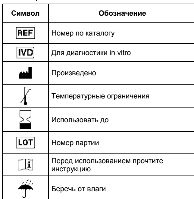
ТАБЛИЦА СИМВОЛОВ И ОБОЗНАЧЕНИЙ