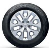
16" aluminiu , design Oraga