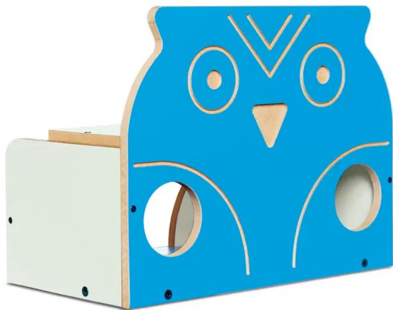
43) Saltea pliabilă din spumă – 2 secțiuni ( loc pentru inserarea imaginilor )