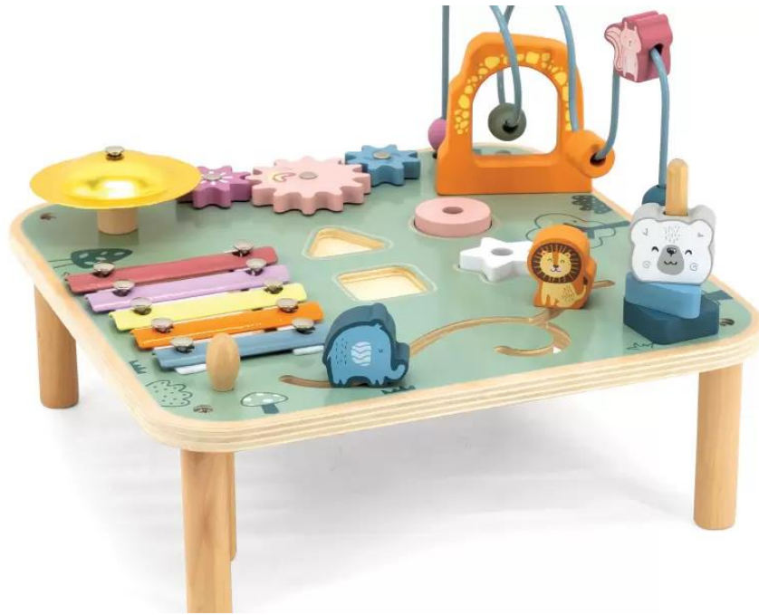
47) Set muzical percuție pentru copii ( loc pentru inserarea imaginilor )