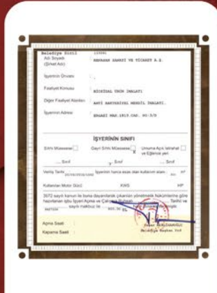
BİYOSİDAL ÜRÜN ÜRETME İZİNİMİZ