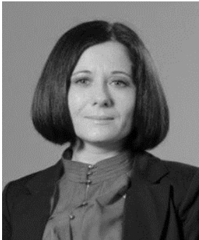
Consultant Taxe Baker Tilly Moldova