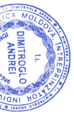
Анеха 1 la tabelul nr.1