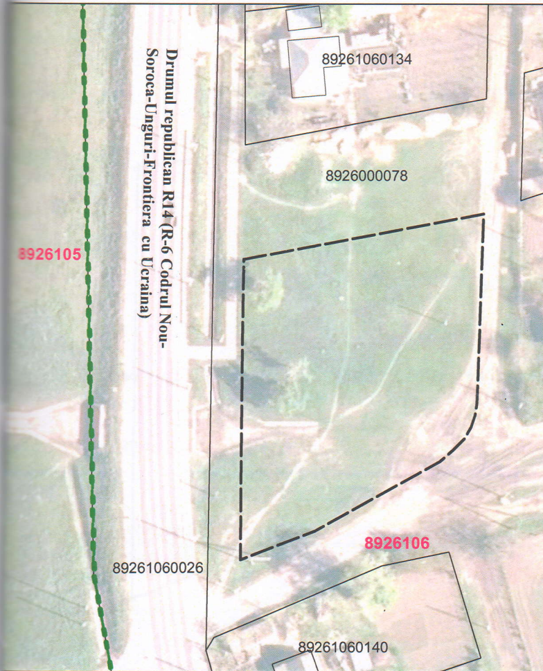
Schema de încadrare