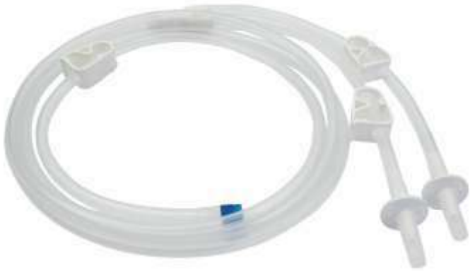
MN 300 | Y T.U.R Irrigation Set Y Tipi T.U.R Seti