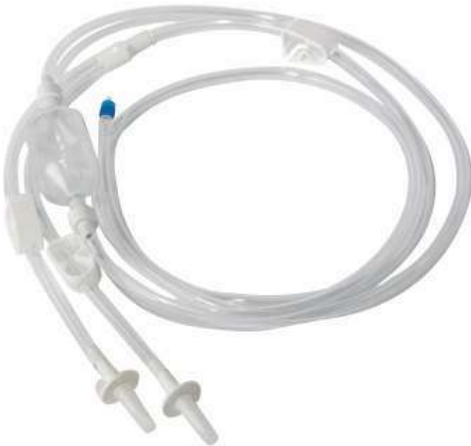
MN 301 | Y T.U.R Irrigation Set With Manual Pressure Pump Y Tipi T.U.R Seti Puarlı