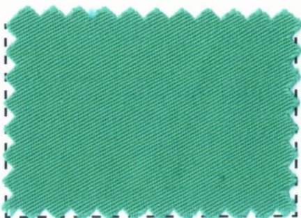
Oil Green #16-07