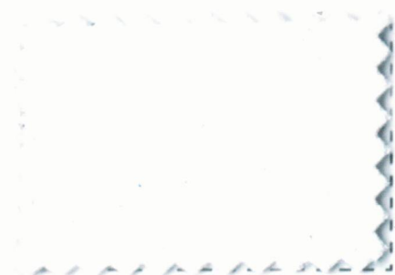
Optical White #01

PĂSTRAȚI ÎN LOC USCAT, RĂCOROS, FĂRĂ LUMINĂ DIRECTĂ A SOARELUI