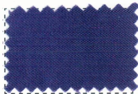
Dark Lilac #16-08