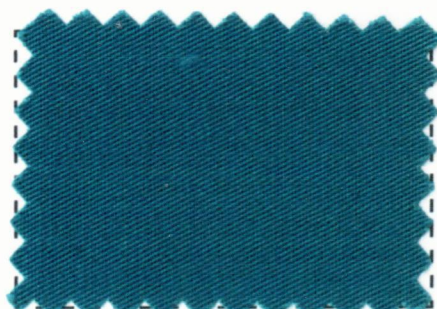
Dark Marine #10