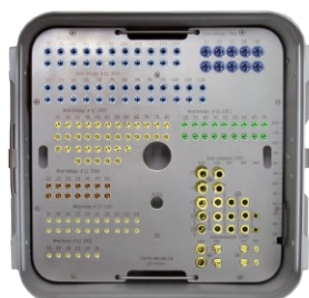
Statyw na elementy blokujące gwoździe CHARFIX (komplet z puszką bez implantów) Stand for CHARFIX nail locking elements (set with a box without implants) Подставка д/блокир.элементов стержней CHARFIX (комплект с контейнером без имплантатов)