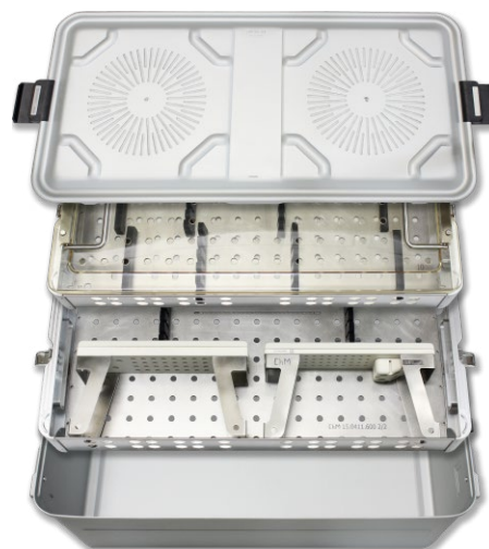
Statyw na wkręty i gwoździe udowe CHARFIX (komplet z puszką bez implantów) Stand for CHARFIX femoral screws and nails (set with a box without implants) Подставка для винтов и стержней для бедренной кости CHARFIX (комплект с контейнером без имплантатов)