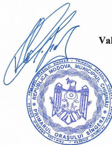
Valeriu POPA PRIMAR