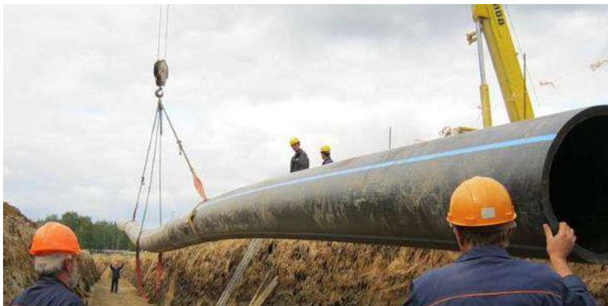
Imagine 2. Conducta PE buc 6 sau 12 m/l

*Se montează prin montare per bucăți 6/12 m/l cu ajutorul macaralei conform normei de deviz AcA52D.