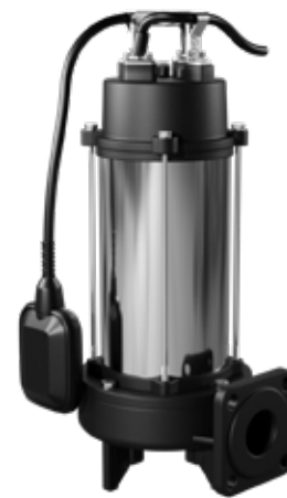
KRAKEN 1800 DF