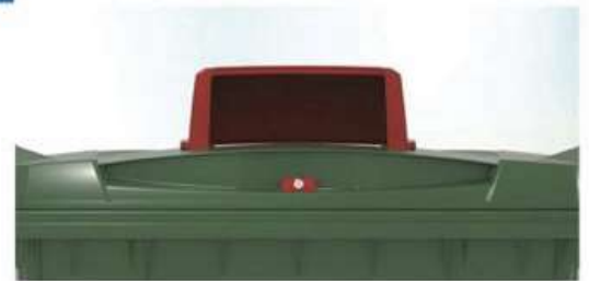
Hood and Gravity Lock