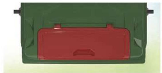
Lid in Lid