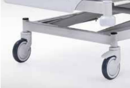
ÇAPRAZ FREN SİSTEMİ CROSS LOCKABLE