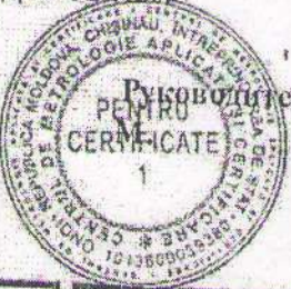
Схема сертификации З. Надзор осуществляется ОСП ГП ЦПМС один раз в год. Сертификат действителен только в случае обеспечения информацией на государственном языке каждой упаковки продукции в соответствии с действующим законодательством. Договор № 5383/2018 от 04.09.2018. Дело № 1130.