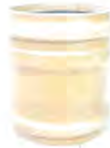
Vedere generală ramificație canalizare PVC.