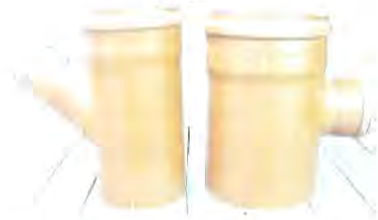
Vedere generală piesă de inspecție canalizare din PVC.