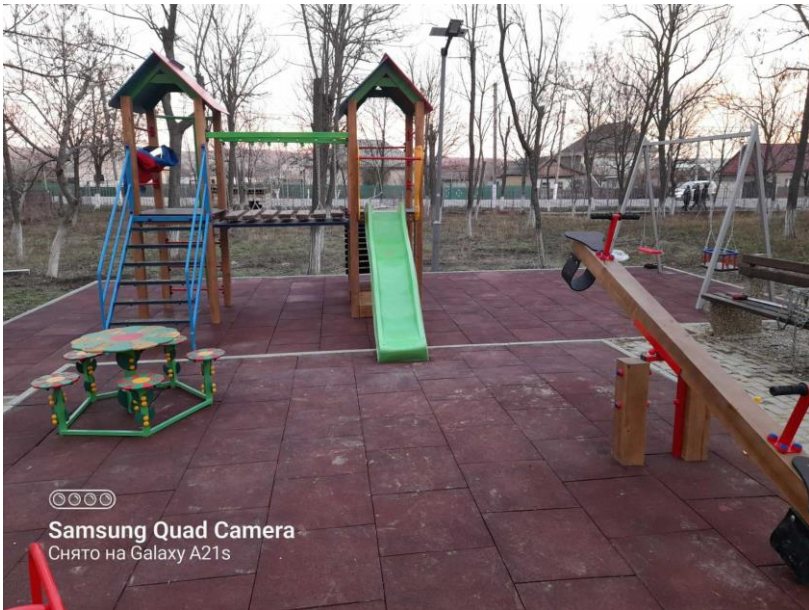
©©©© Samsung Quad Camera Снято на Galaxy A21s