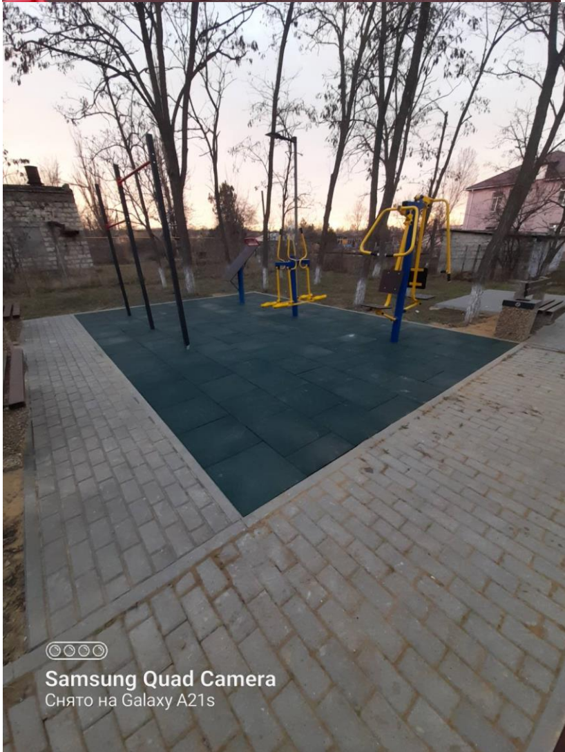
©©©© Samsung Quad Camera Снято на Galaxy A21s