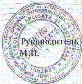
Схема сертификации 3. Надзор осуществляется ОСП ГП ЦПМС один раз в год. Сертификат действителен только в случае обеспечения информацией на государственном языке каждой упаковки продукции в соответствии с действующим законодательством. Договор № 5816/2019 от 06.02.2019. Дело № 1674.

Руководитель органа по сертификации М.П.