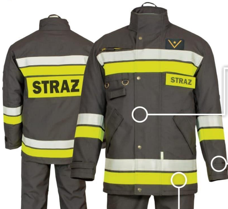
US-03 PODPINKA ODPINANA