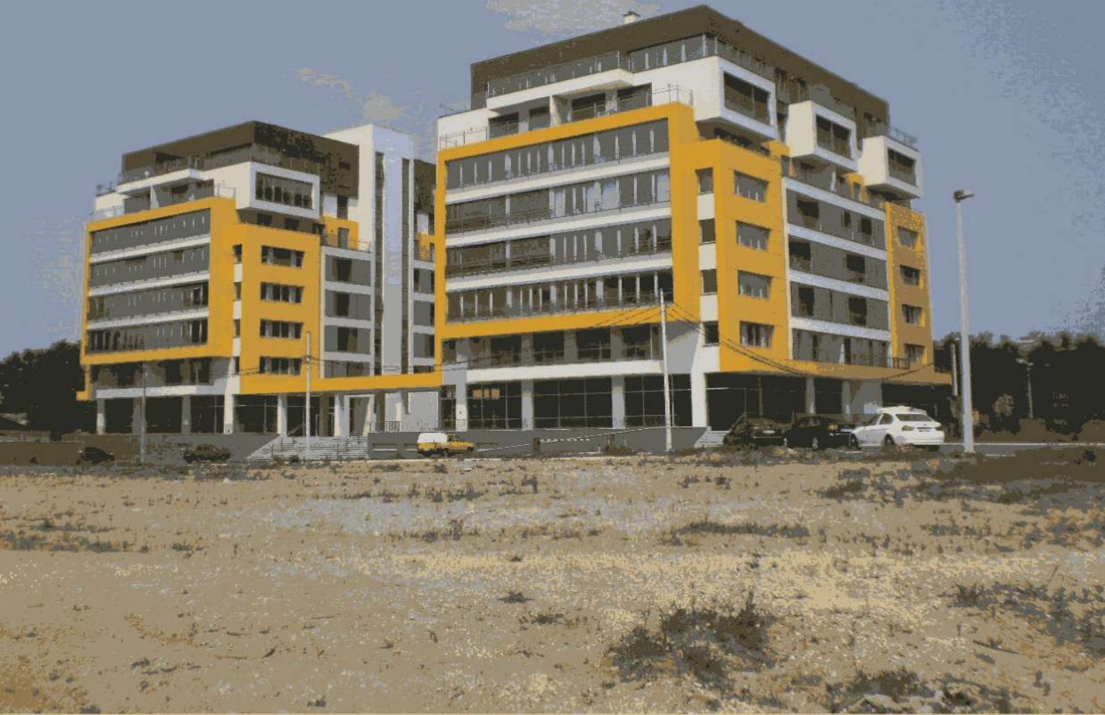
Complex locativ, or. Belgrad, (Serbia)