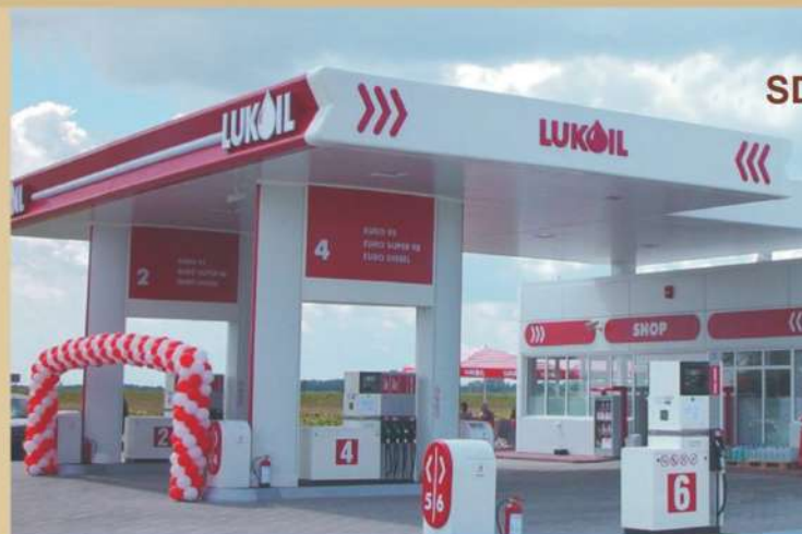
SDC LUKOIL ROMÂNIA