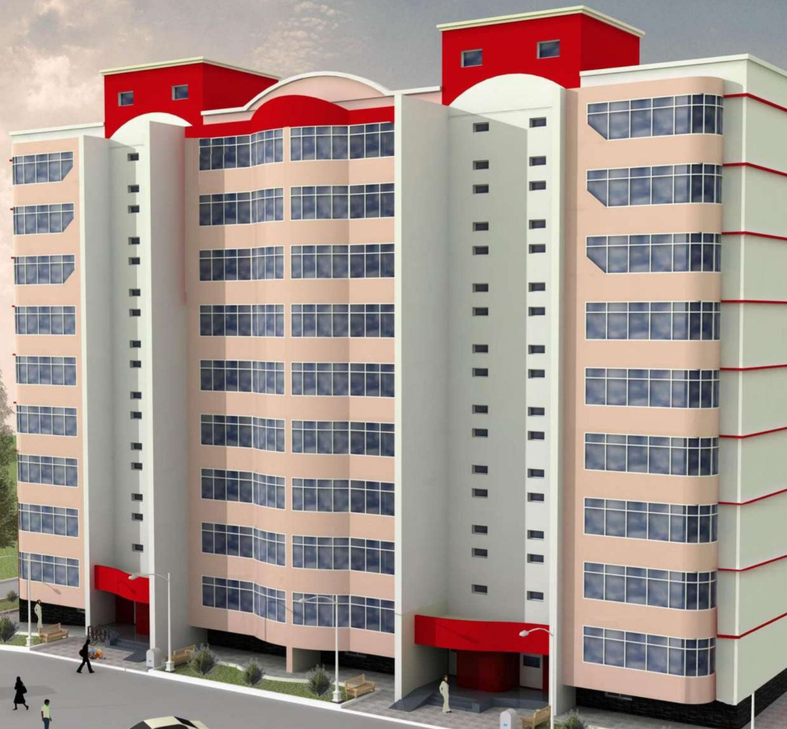
CASE DE LOCUIT, or. CHIȘINĂU