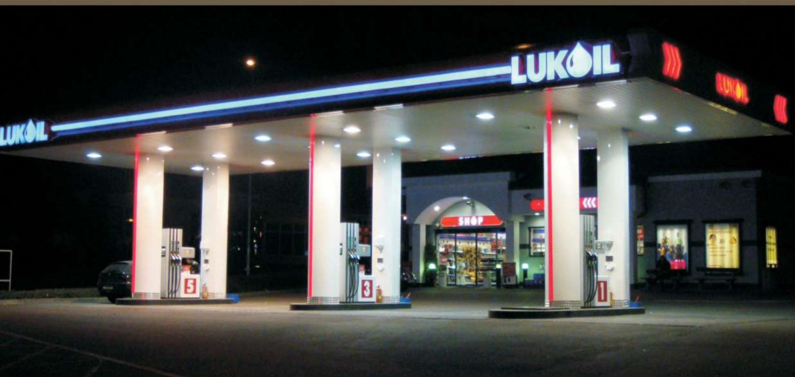
SDC LUKOIL CEHIA