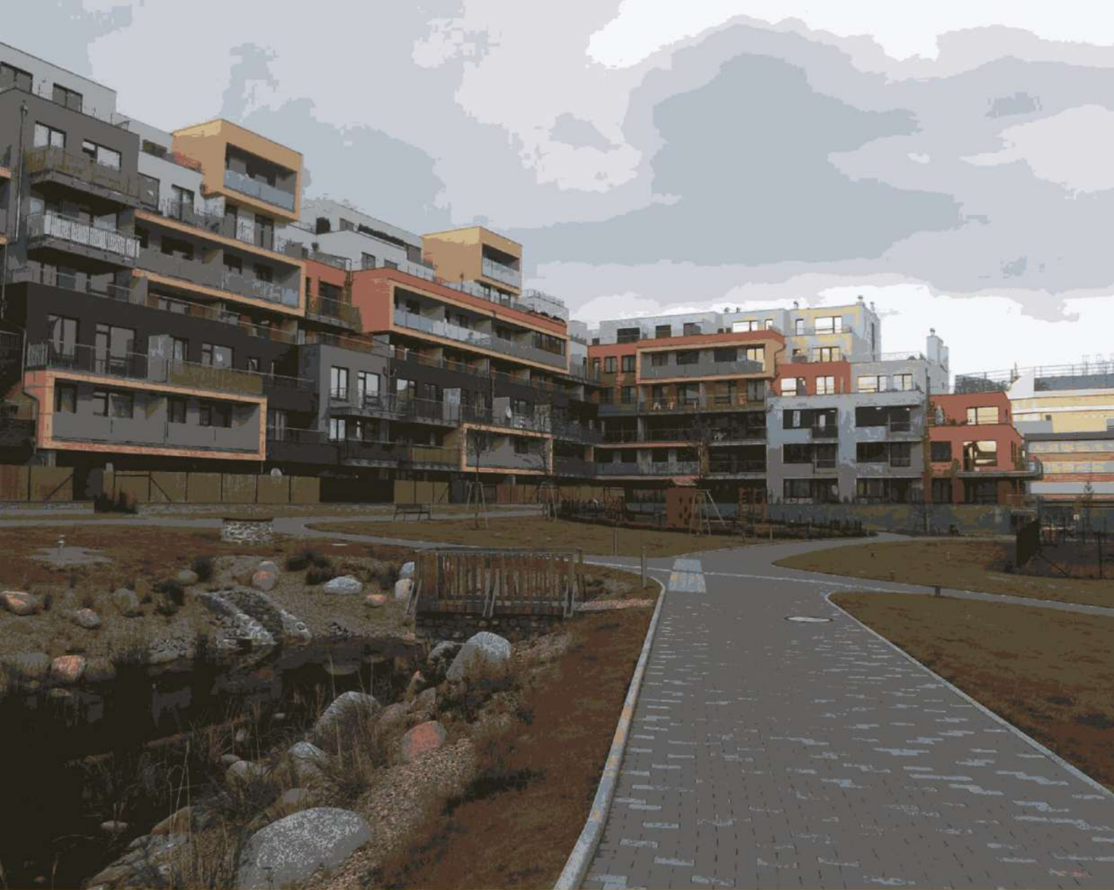
Complex locativ, or. Praga, (Cehia)