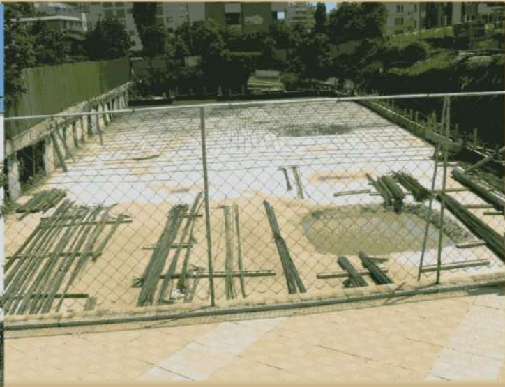
Cartier de vile, or. Chişinău (Moldova)