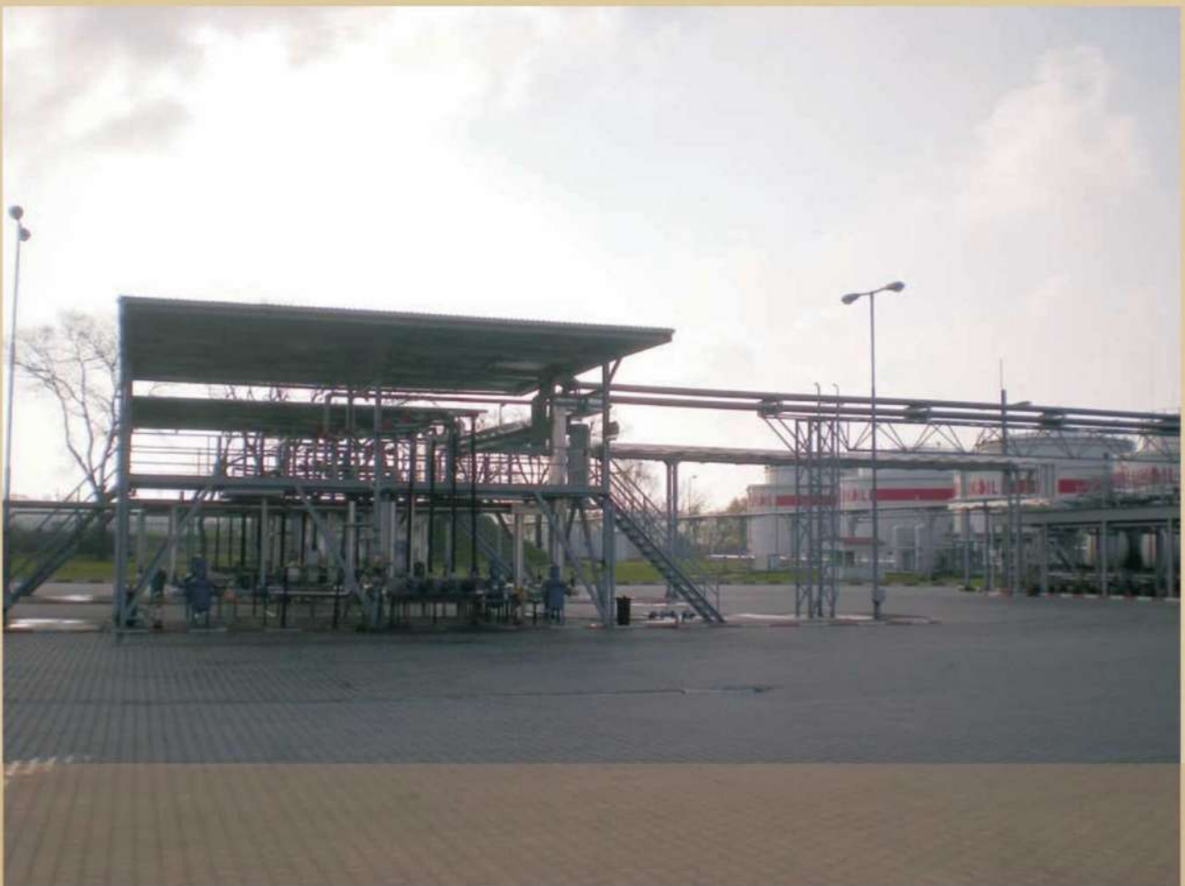
DEPOZIT PETROLIER DUNAFELDVAR – UNGARIA