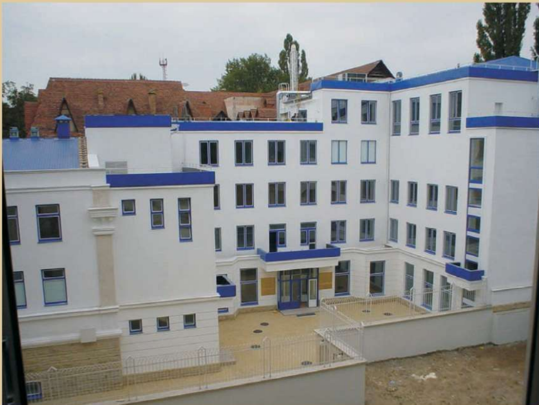
CENTRUL EVREIESC DE CULTURĂ, CULTE ȘI FILANTROPIE (MOLDOVA)