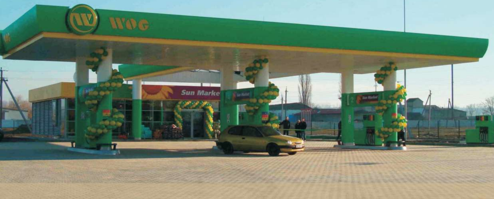
SDC WOG UCRAINA