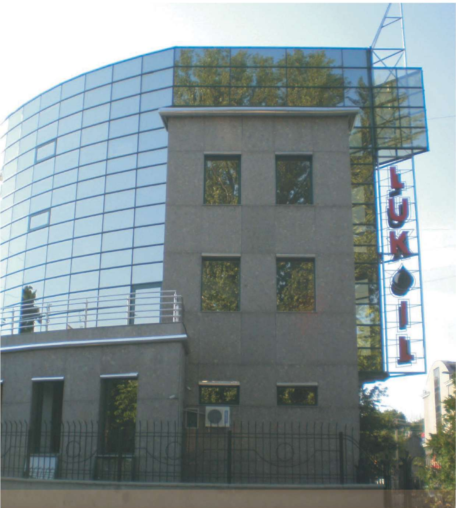
SEDIUL "LUKOIL" (CHIȘINĂU - MOLDOVA)