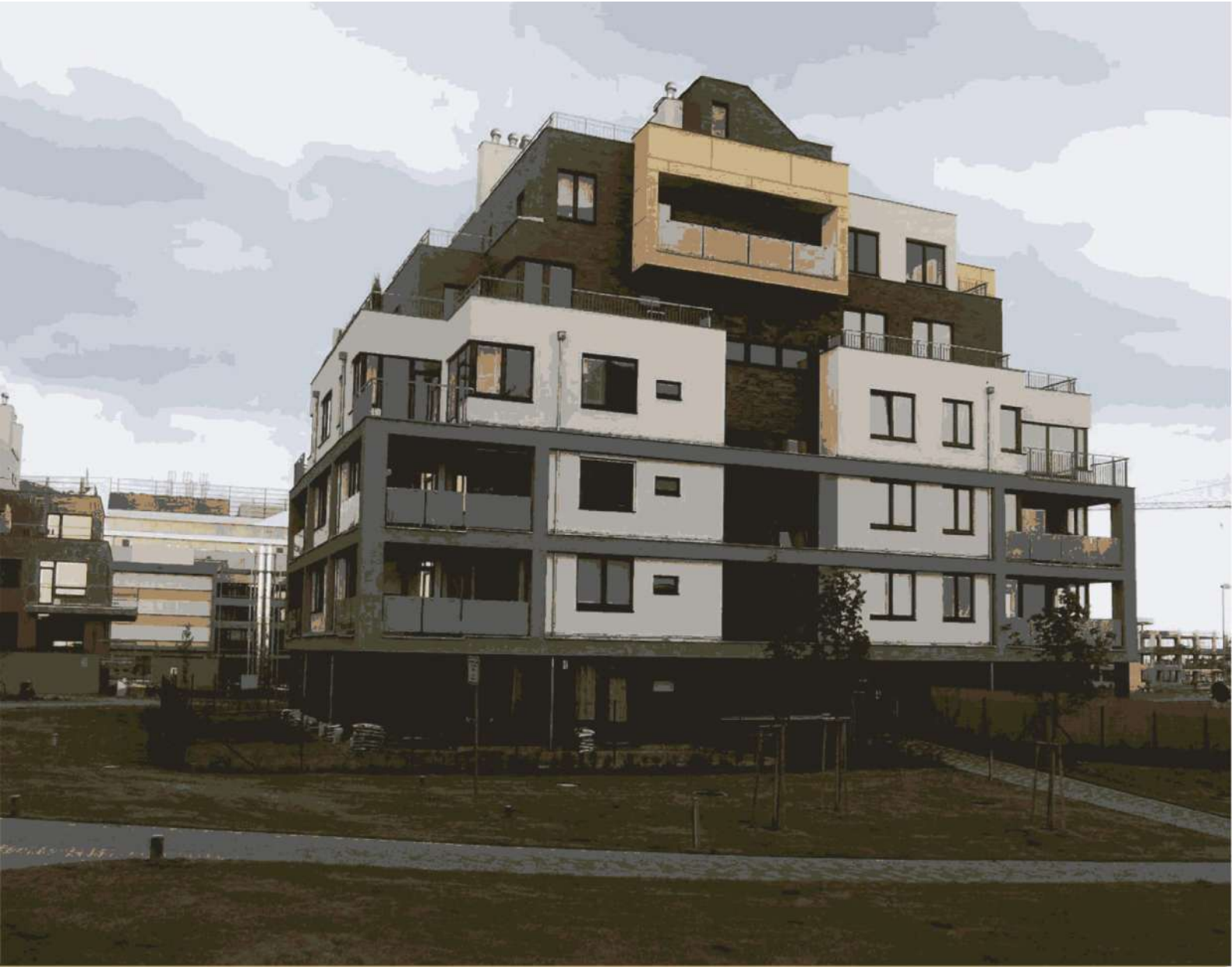
Complex locativ, or. Ploești, (România)