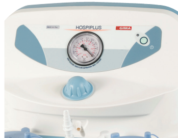
Clinic Plus Basic and Hospi Plus Basic