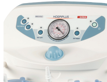
Clinic Plus Full and Hospi Plus Full with foot switch and electronic flow direction regulator