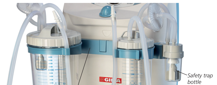
Multipurpose rail with 5 locking slots offers versatility to operators in changing accessories