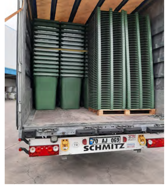
Option Color Models & Logistics