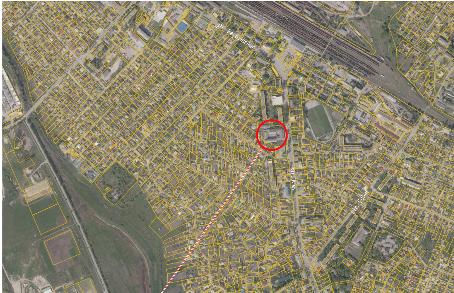
Schema de amplasare a Gimnaziului

13. Fazele determinante a lucrarilor. La toate lucrarile ascunse se intocmesc procese verbale conform NCM A.08.01:2016 "Organizarea constructiilor": - executarea caracas din lemn si metal; - executarea invelitorii; Protectia anticoroziva a constructiilor din metal se va efectua in corespundere cu NCM E.04.04:2016 "Proiectarea protectiei anticorozive a constructiilor". Constructiile din metal trebuie sa fie grunduite cu 1 strat de grund ГФ-021 (ГОСТ 25125-82), urmata de vopsirea cu vopsea emailata ПФ-133 (ГОСТ 926-82) cu grosimea 100 мкм. Toate elementele din lemn se vor executa din pin de calitate II cu umiditatea nu mai mare de 20%. Toate elementele din lemn vor fi prelucrate cu substante antiseptice si antiperene conform NCM F.05.01-2007 "Proiectarea constructiilor din lemn".