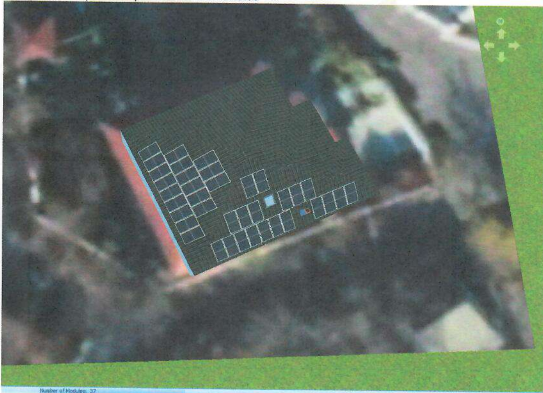
Vederea cu amplasarea panaorilor fotovoltaice