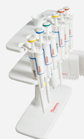
9420400 Finnpipette Fスタンド