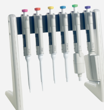
9420290 Finnpipetteスタンド (バータイプ)