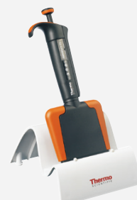
9420390 マルチチャンネルスタンドF