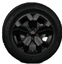
17", aliaj usor , design full black