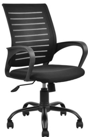
Scaun de oficiu