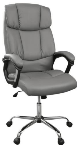
Scaun de birou