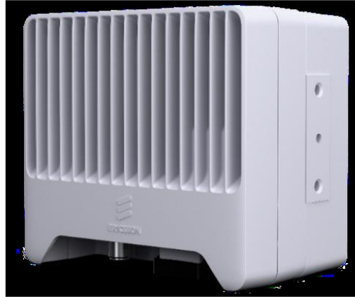
Figura 3 - Imagine exemplificare unitate ODU Mini-Link 6363