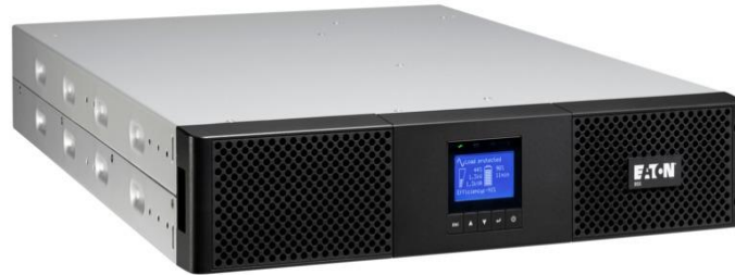
Figura 5 - Imagine exemplificare Eaton 5SC 3000i RT2U