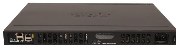
Figura 6 - Imagine exemplificare Router CISCO ISR 4431 K9