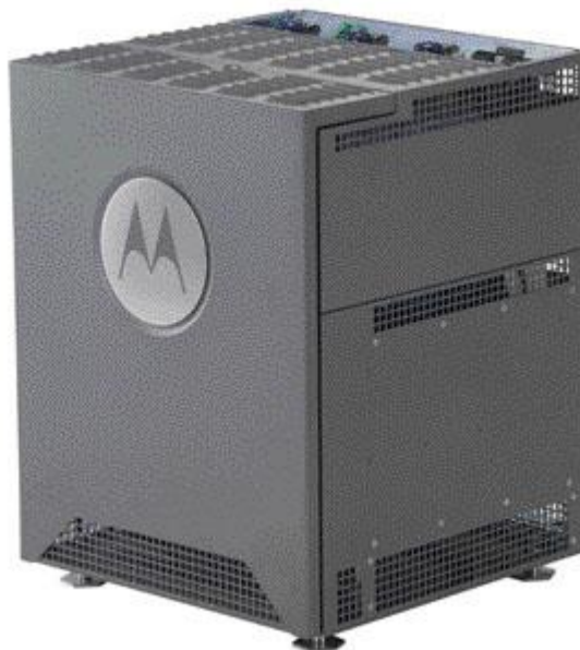
Figura 10 - Imagine exemplificare MTS2