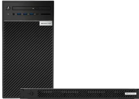
Figura 9 - Imagine exemplificare NVR Husky 350 Rack, Win10, 4TB