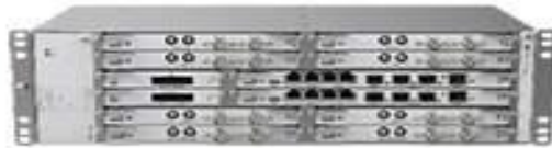
Figura 2 - Imagine exemplificare unitate IDU Mini-Link 6692