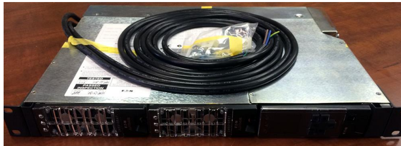
Figura 4- Imagine exemplificare DC -48V – EATON RM3-400