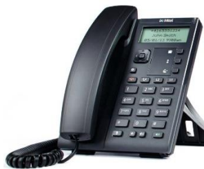
Figura 8 - Imagine exemplificare IP telefon Mitel 6863i