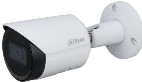
Figura 12 - Imagine exemplificare IP CAM