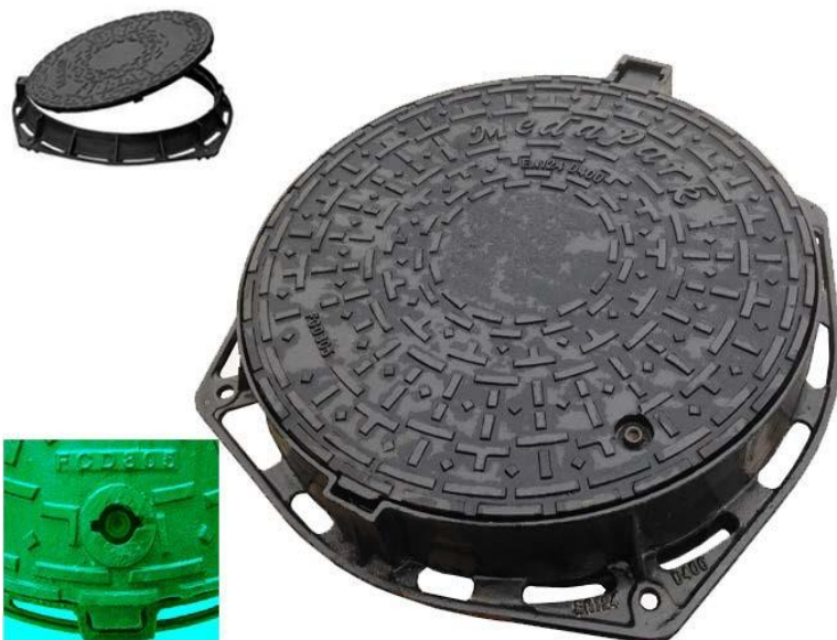
Grătar fontă clasa C-250/D 400