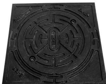
Capac fontă clasa C-250/D 400