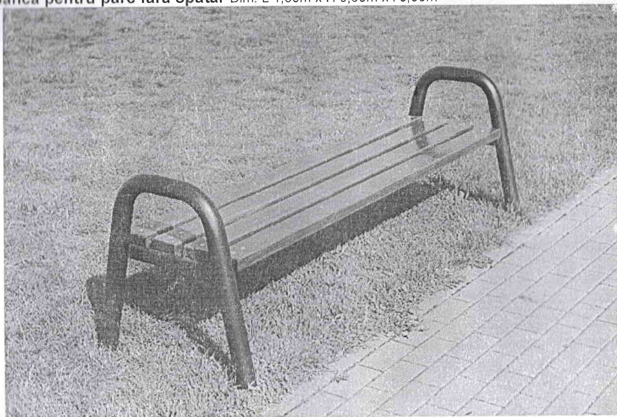
Banca pentru parc fara spatar Dim. L 1,80m x H 0,60m x l 0,60m