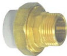
mufa cu olandez FE