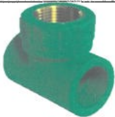
teu cu filet interior