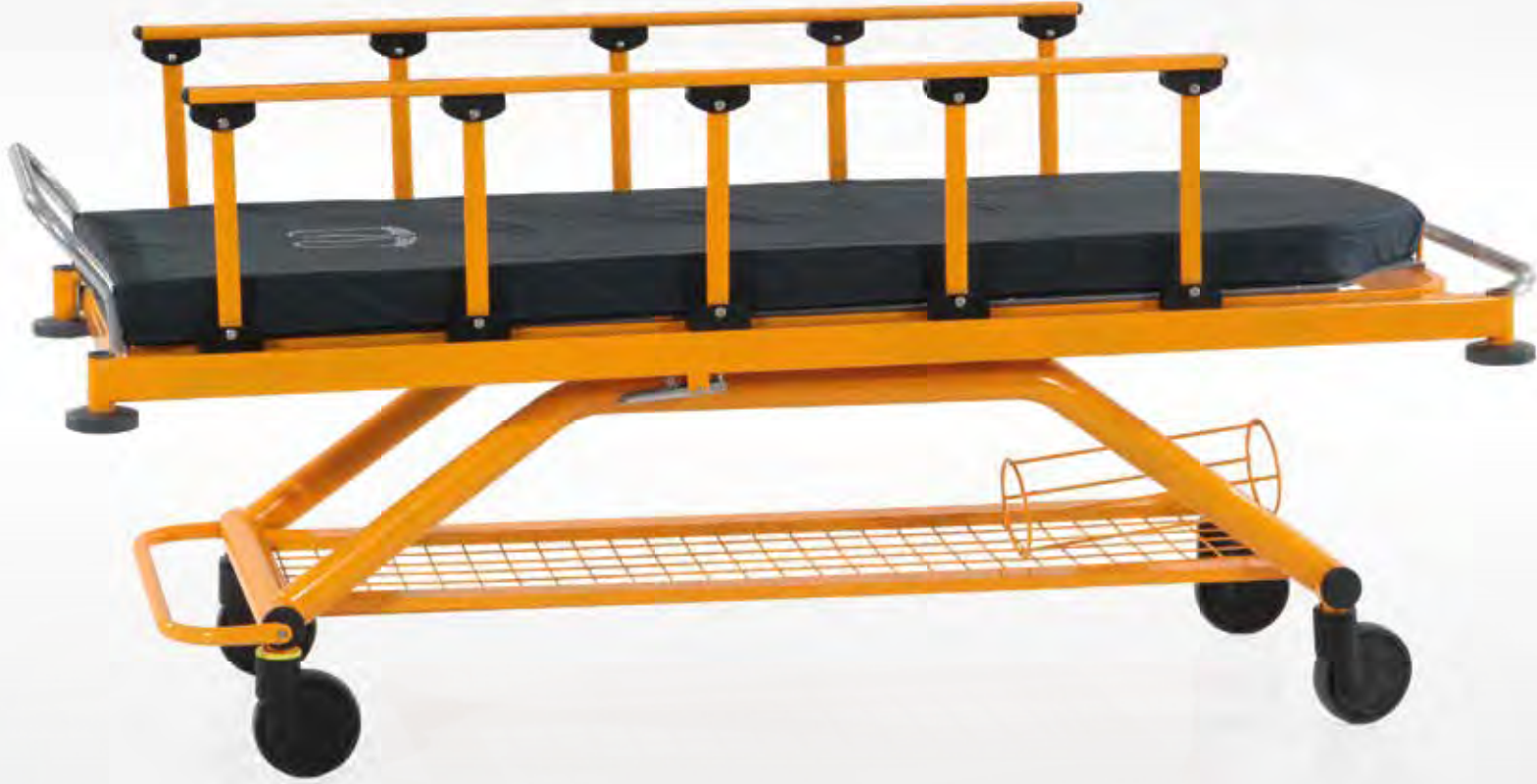
Transfer Pozisyonu / Transfer Position