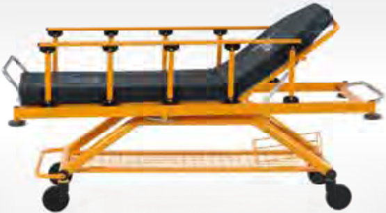
Trendelenburg / Trendelenburg