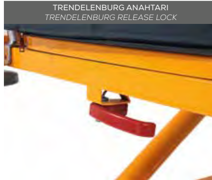
TRENDELENBURG ANAHTARI TRENDELENBURG RELEASE LOCK