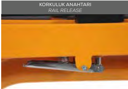
KORKULUK ANAHTARI RAIL RELEASE