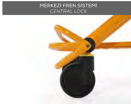
MERKEZİ FREN SİSTEMİ CENTRAL LOCK