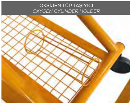
OKSİJEN TÜP TAŞIYICI OXYGEN CYLINDER HOLDER