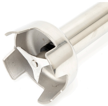
\varnothing 80mm stainless steel rod