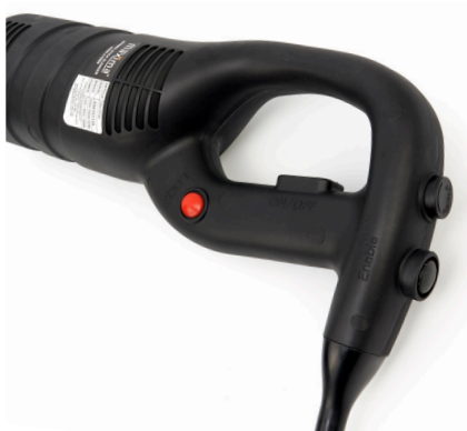
Simple and robust operating switches