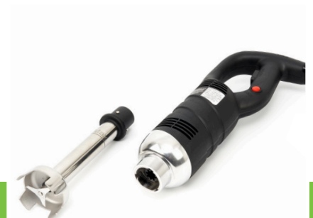
Easy to dismantle and clean