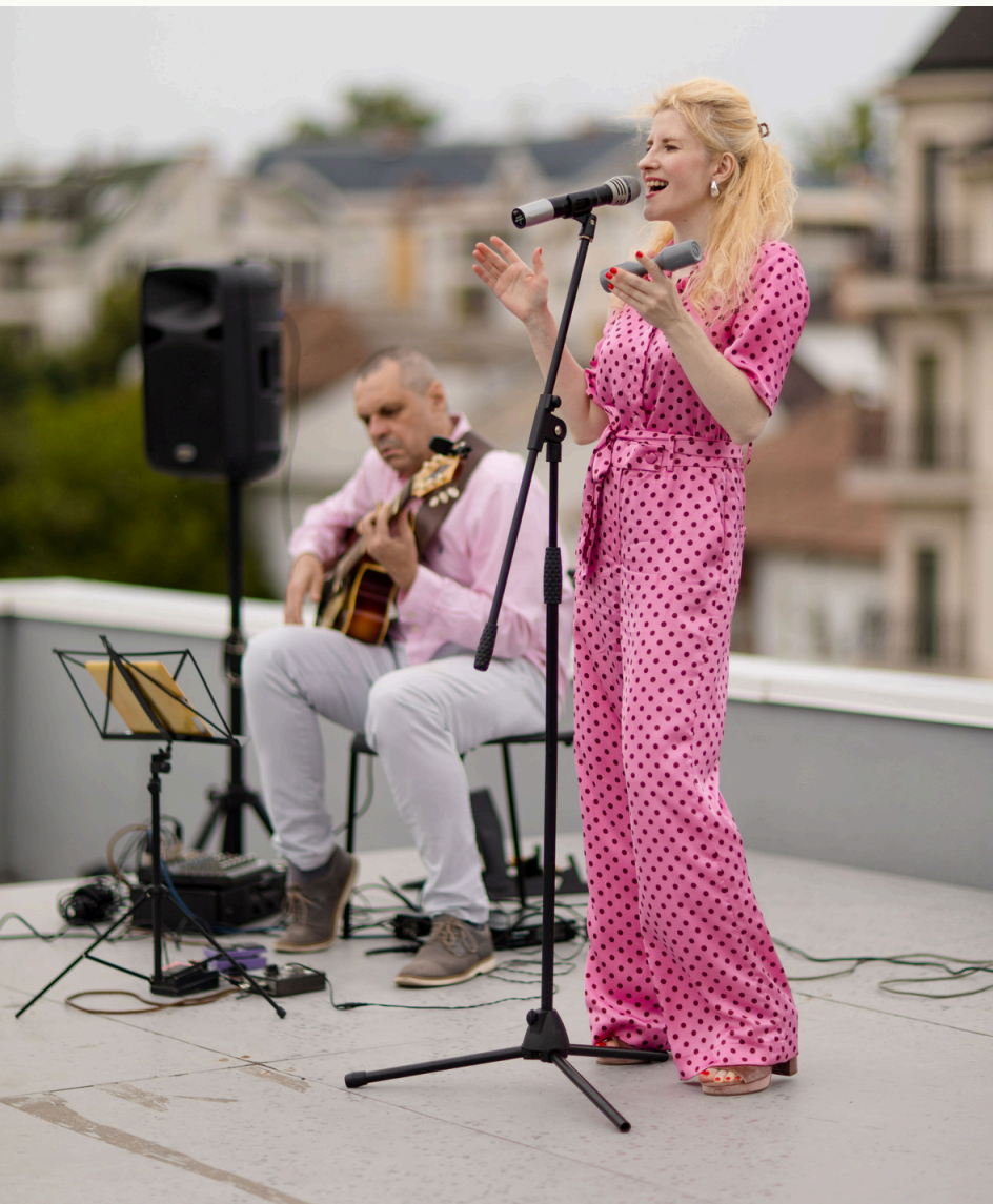
SPACE CABLE - ARTISTI