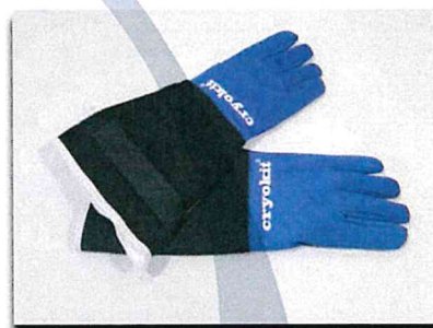
Mod. Cryo Plus 2.0