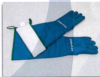
Mod. Cryo Plus 2.1