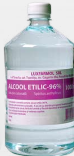
Спирт этиловый медицинский 96%, 100 мл, 1000 мл