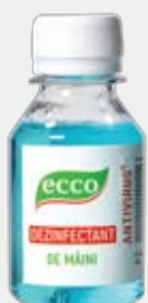
Farmol-Cid 100 мл