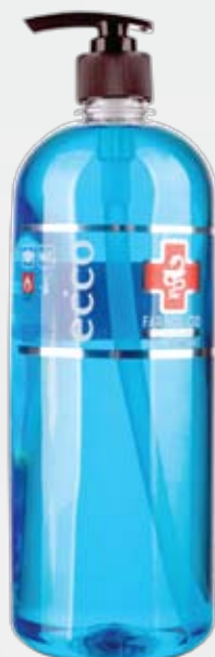
HOME Farmol-Cid 1 л с дозатором