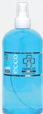
HOME Farmol-Cid 500 мл, спрей