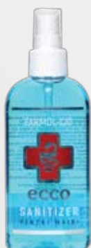
HOME Farmol-Cid 100 мл, спрей