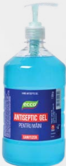
Антибактериальный гель для рук ЕССО, 1 л, с дозатором