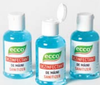
Farmol-Cid 50 мл, флип топ