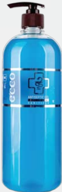
Антибактериальный гель для рук HOTEL, 1 л с дозатором