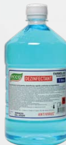
Farmol-Cid 1 л