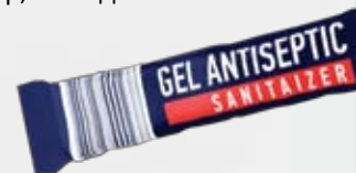
Антибактериальный гель для рук ECCO, 3 гр, монодоза