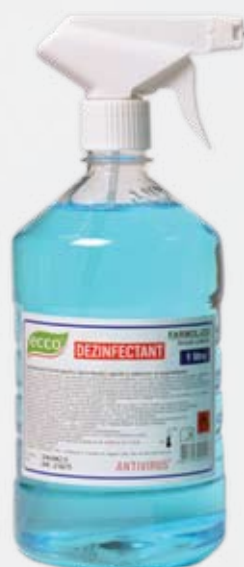
Farmol-Cid 1 л с триггером