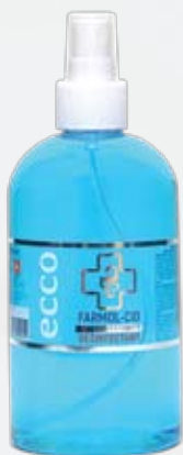
HOME Farmol-Cid 350 мл, спрей