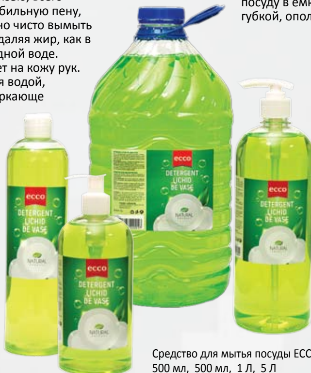
Средство для мытья посуды ЕССО 500 мл, 500 мл, 1 Л, 5 Л

Нанести небольшое количество средства на губку, вспенить, вымыть посуду пенным составом, смыть водой. Или развести концентрат с водой из расчета 3-5 мл на литр воды, опустить посуду в емкость с раствором, потереть губкой, ополоснуть посуду.