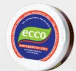
Антибактериальный гель для рук ECCO, 35 г