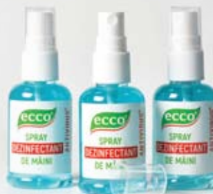
Farmol-Cid 50 мл, спрей