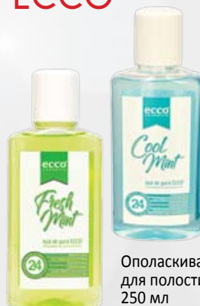
Ополаскиватель для полости рта ЕССО 250 мл

Использовать 2 раза в день: утром и вечером.