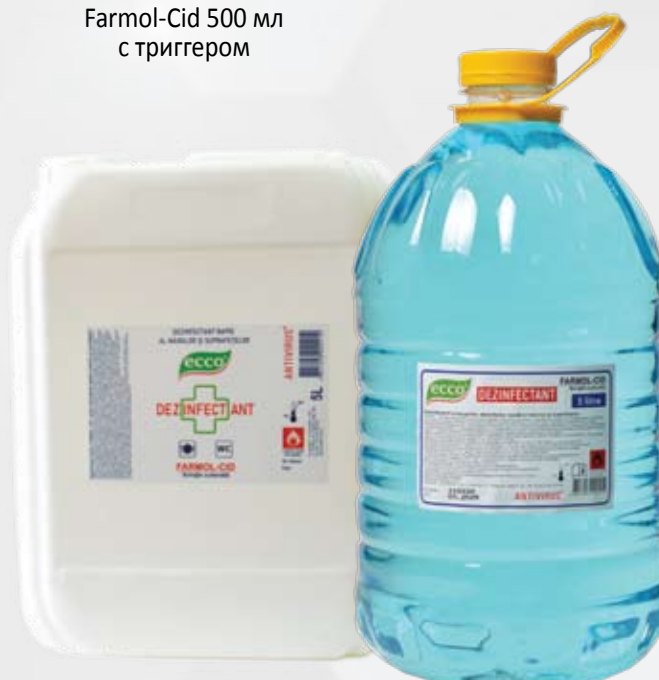
Farmol-Cid 5 л