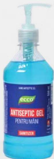
Антибактериальный гель для рук ЕССО, 500 мл, с дозатором

Лучший подарок для ваших близких – это ваша забота о них! Подари заботу вместе с «Luxfarmol»