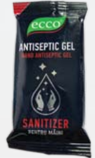
Антибактериальный гель для рук ECCO, 35 гр