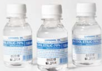
Спирт этиловый медицинский 70%, 100 мл, 1000 мл