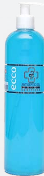
Антибактериальный гель для рук HOME, 500 мл, с дозатором