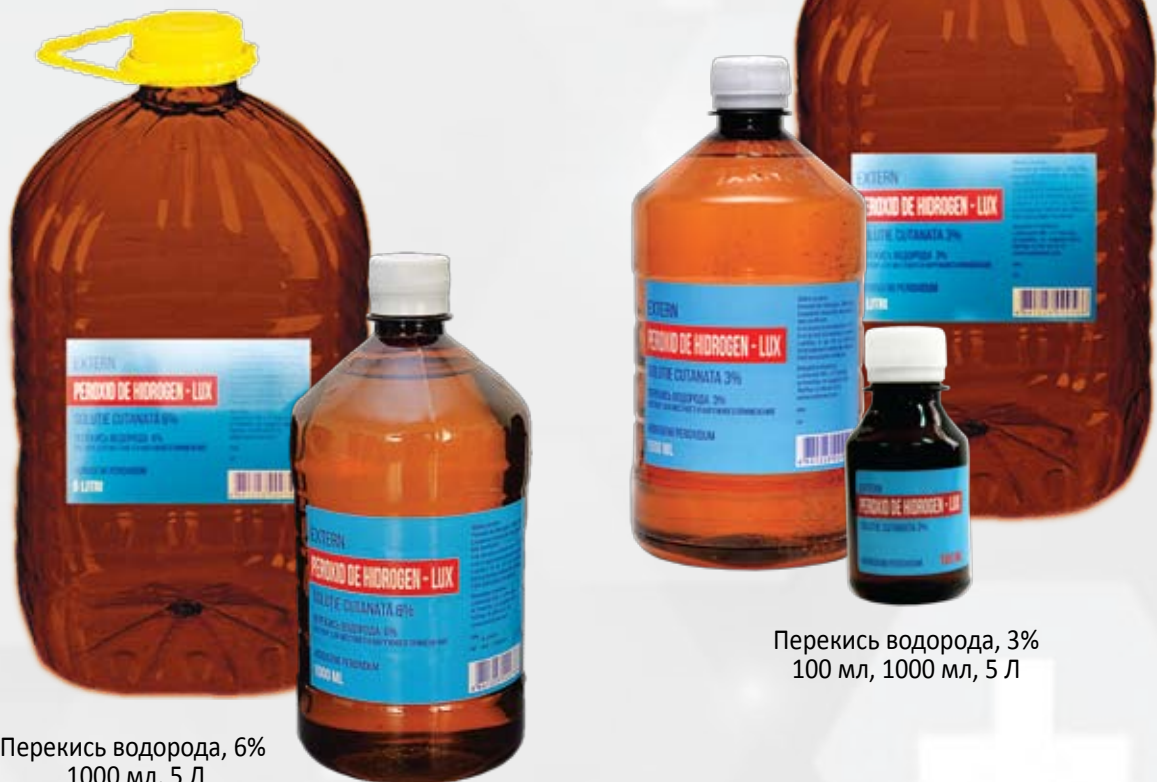
Перекись водорода, 6% 1000 мл, 5 Л

Перекись водорода используется для поверхностной обработки ран; остановки кровотечения из мелких кровеносных сосудов (капилляров) при поверхностных ранах; носовых кровотечений; полосканий при стоматите, тонзиллите; гинекологических заболеваниях.