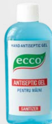
Антибактериальный гель для рук ECCO, 100 мл