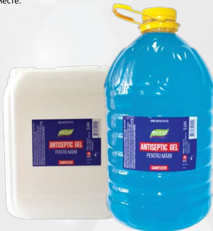
Антибактериальный гель для рук ЕССО, 5 л