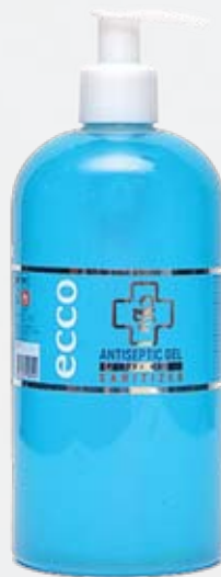
Антибактериальный гель для рук HOME, 500 мл, с дозатором