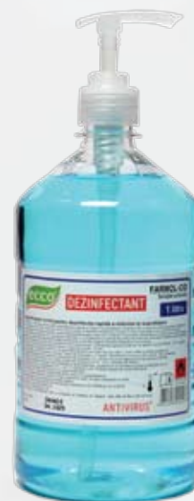
Farmol-Cid 1 л с дозатором