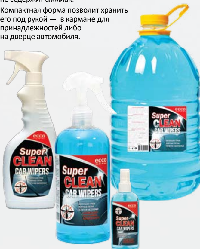
Спрей для автомобильных стекол ECCO CLEANING® 100 мл, 500 мл, 500 мл, 5 Л

Компактная форма позволит хранить его под рукой — в кармане для принадлежностей либо на дверце автомобиля.