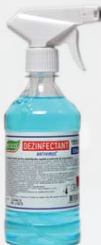
Farmol-Cid 500 мл с триггером