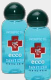
Антибактериальный гель для рук HOTEL, 30 мл