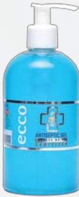
Антибактериальный гель для рук HOME, 350 мл, с дозатором