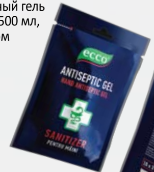
Антибактериальный гель для рук ECCO, 20x3 гр, монодоза