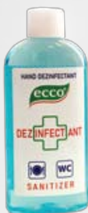
Farmol-Cid 100 мл