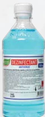
Farmol-Cid 500 мл