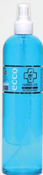
HOME Farmol-Cid 500 мл, спрей