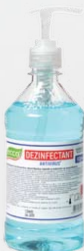
Farmol-Cid 500 мл с дозатором