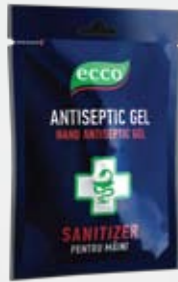
Антибактериальный гель для рук ECCO, 10x3 гр, монодоза