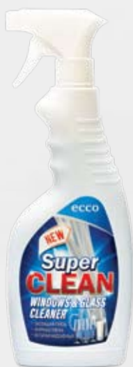
Спрей для стекол и стеклянных поверхностей ECCO CLEANING®

Благодаря уникальной формуле спрей для стекол визуально сглаживает царапины, делая их менее заметными. Улучшает отражение света, а при постоянном применении улучшает светопрозрачность.