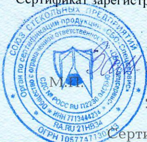
Схема сертификации: 2с

Сертификат зарегистрирован на сайте СДС № РОСС RU.П2230.04СБНО www.sbosspr.ru