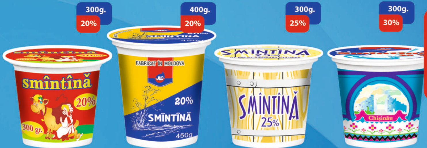
SMĂNTÂNĂ, PH. TERMEN DE VALABILITATE 5 ZILE. CANTITATE ÎN CUT. 10 BUC.