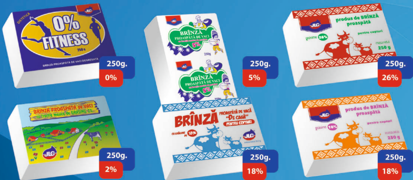
BRÂNZĂ DE VACI. TERMEN DE VALABILITATE 96 ORE.