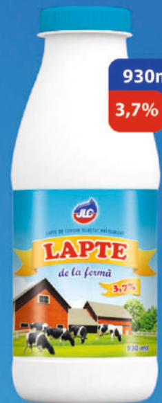
LAPTE PASTEURIZAT T/CLASSIC. TERMEN DE VALABILITATE 3 ZILE. CANTITATE ÎN CUT. 18 BUC.