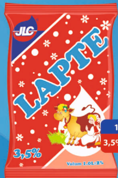
LAPTE. TERMEN DE VALABILITATE 96 ORE. CANTITATE ÎN CUT. 15 BUC.