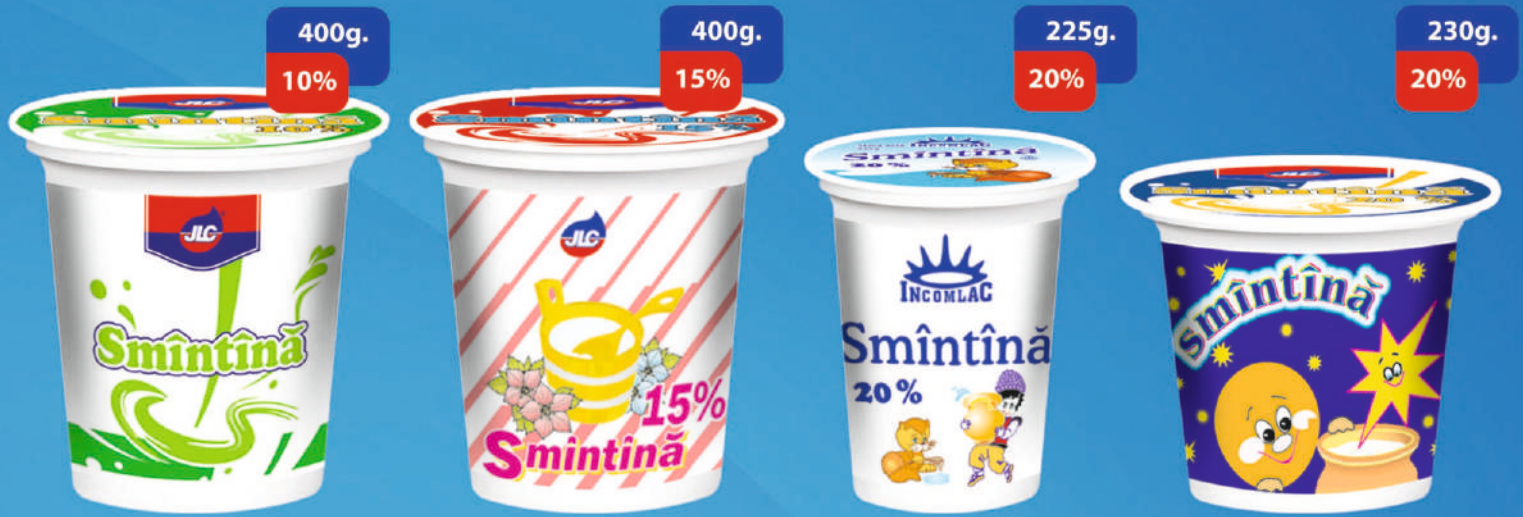
SMĂNTÂNĂ, PH. TERMEN DE VALABILITATE 5 ZILE. CANTITATE ÎN CUT. 10/15 BUC.