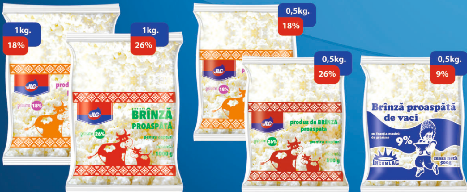
PRODUS DE BRÂNZĂ.