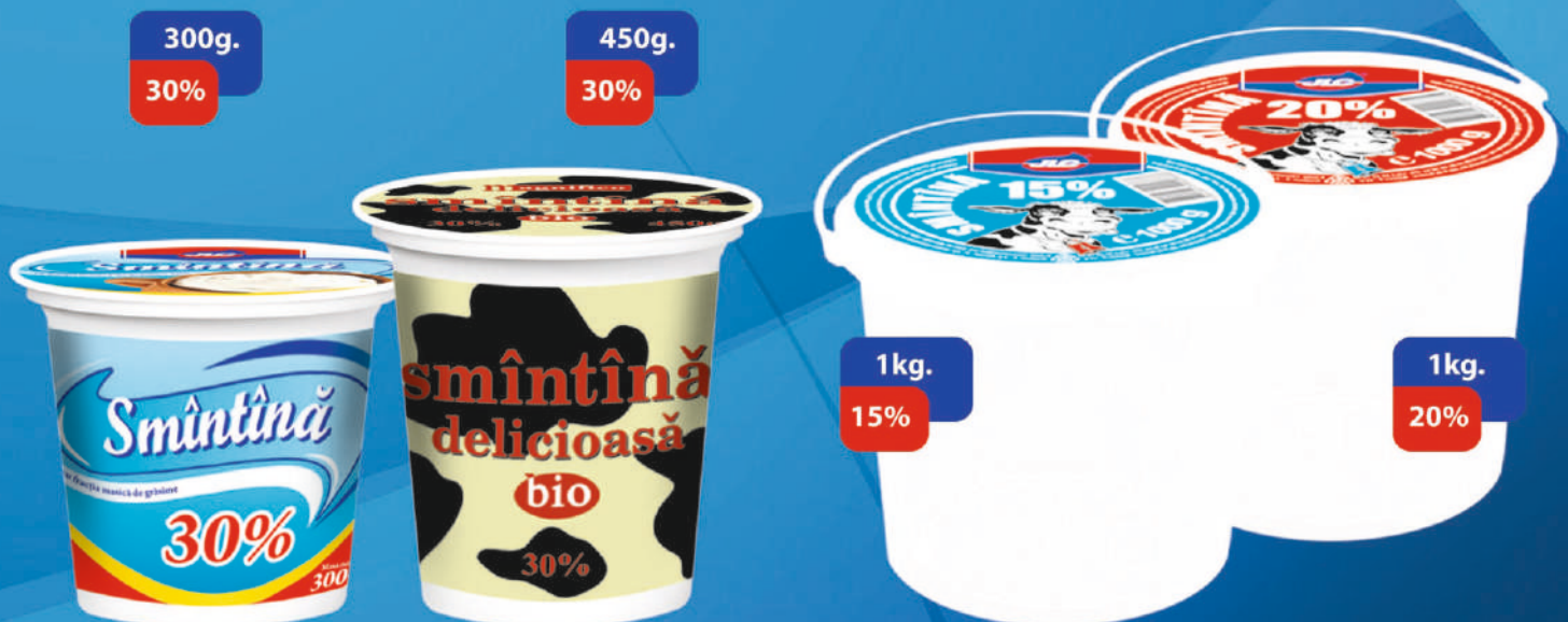
SMĂNTÂNĂ, PH. TERMEN DE VALABILITATE 5 ZILE. CANTITATE ÎN CUT. 10 BUC.