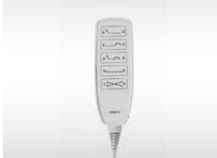
HASTA EL KUMANDASI PATIENT HANDSET