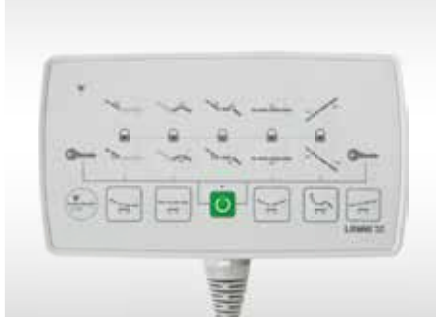
HEMŞİRE KONTROL ÜNİTESİ NURSE CONTROL UNIT