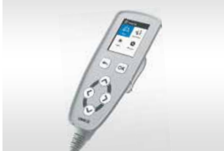
TARTI GÖSTERGESİ SCALE INDICATOR