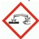
GH 05 - Coroziv

Fraze de pericol: H 302: Nociv in caz de inghitire.