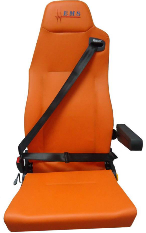
ISRI® Safe Seat V1

ISRI® Safe Seat V1: For left/right walls ISRI® Safe Seat V2: For separator wall