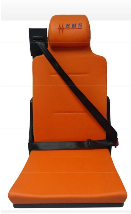
ISRI® Safe Seat V2